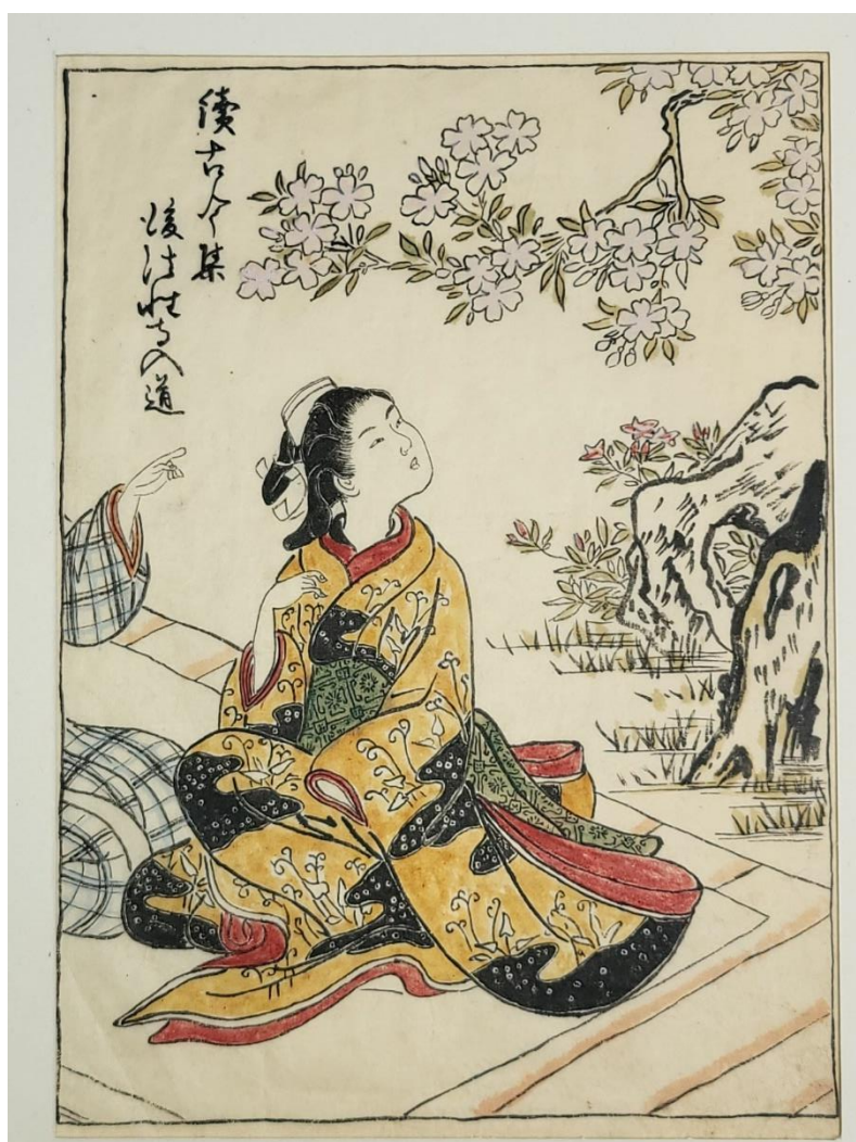
Manga préparatoire, Sukenobu (1671-1750)